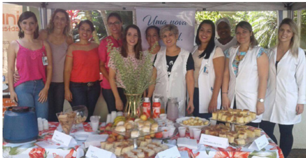
Café da Manhã, tarde e noite para as colaboradoras

Encerrando a programação, no dia 08, sexta-feira, Dia Internacional da Mulher, o Hospital Mahatma Gandhi participou do evento ESPAÇO MULHER, realização da ACE, OAB Catanduva e Prefeitura Municipal,