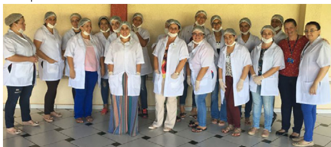
Manicure e depilação do SENAC para as pacientes do HMG

quando o Hospital colocou os produtos da Loja Dona Angola, além de atividades de terapia ocupacional, esportivas e outras, em plena Praça da República.