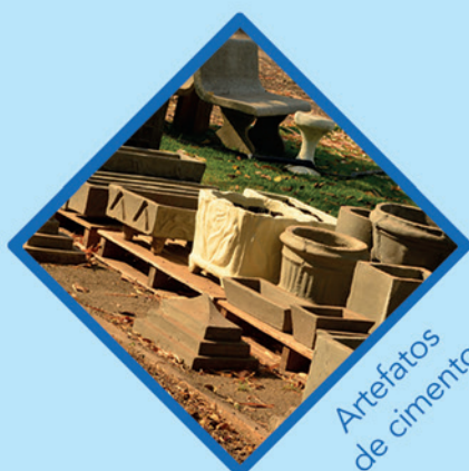
Artefatos de cimento