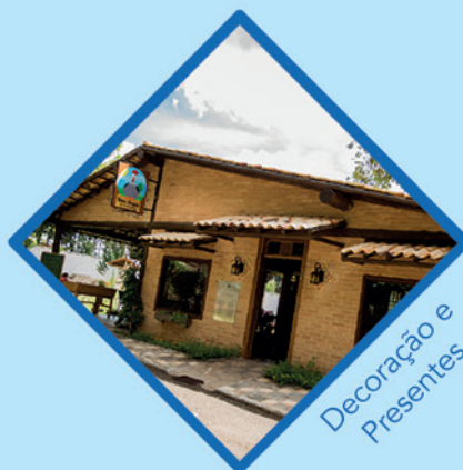
Decoração e Presentes